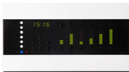
▲ 6迴路節能調光控制器 EDX-607, All-In-One Wall Station

設計師為避免業主不開窗而造成室內空間的侷促感，特別將客廳保留寬敞的空間格局，刻意不將玄關、客廳、餐廳及書房做任何形式的隔間，大膽的用燈光及天花板造型將公共空間的四個區域做劃分。進入玄關即可看見整個公共區域，卻有很明顯的空間用途區隔。