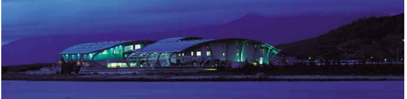
台灣墾丁海洋生物博物館