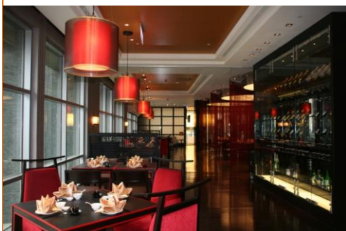
开放式的用餐空间