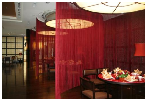
若隐若现的半开放式用餐空间