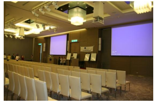
具有会议功能的宴会厅

宴会厅、会议室、餐厅等公共空间分别座落于大厅的左右两侧。宴会厅因具有开会、简报、宴会、上课、表演等多项使用功能, 并可视使用的功能与人数隔成独立的空间, 因此灯光的控制分成三个区域, 可独立区域控制或全区控制。