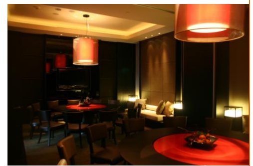
充满神秘色彩的私密包厢